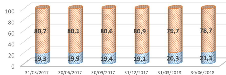
STRUCTURE DE L'ENCOURS DE LA DETTE PUBLIQUE

■ Dette bilatérale ■ Dette multilatérale